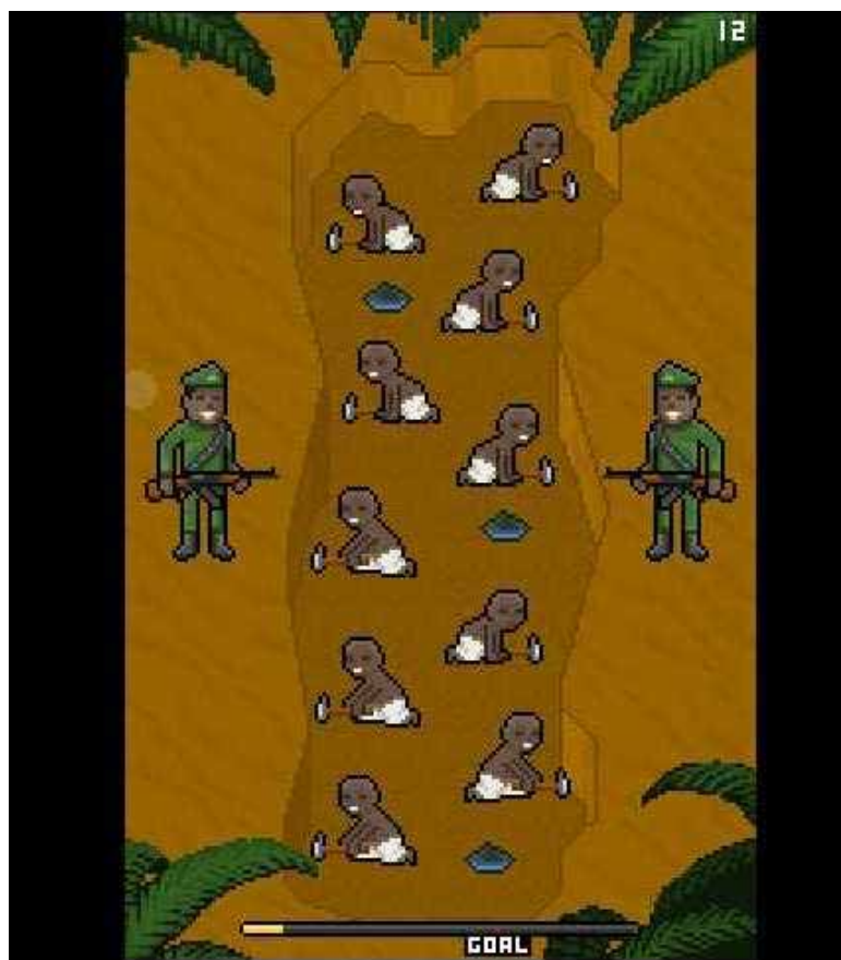
Imagine din jocul Phone Story

minerii (niște copii) să scoată o cantitate mare de coltan. Apoi, controlezi niște personaje care trebuie să prindă niște sinucigași ce se aruncă de la ferestrele unei fabrici de telefoane inteligente din China. Ca și primul mini-joc, și acesta este bazat pe fapte reale. În urmă cu câțiva ani, în acea țară, patronii unei fabrici de telefoane au montat plase în jurul clădirii, alarmați de numărul mare de lucrători care se aruncau de la fereastră. Dincolo de acest mini-joc eu nu am trecut, dar a fost destul ca să prind ideea. Scandalul care a avut în centru acest joc a pornit de la decizia companiei Apple de a-i interzice vânzarea în App Store. Până la acel moment, puțini auziseră de Molleindustria. Apoi, peste noapte, toată lumea și-a îndreptat atenția spre mica echipă. Așadar, scandalul le-a folosit, site-ul atrăgând acum fonduri prin care sprijină familiile sinucigașilor din China și copiii exploatați din Africa. Iată că și jocurile virtuale pot folosi la ceva!