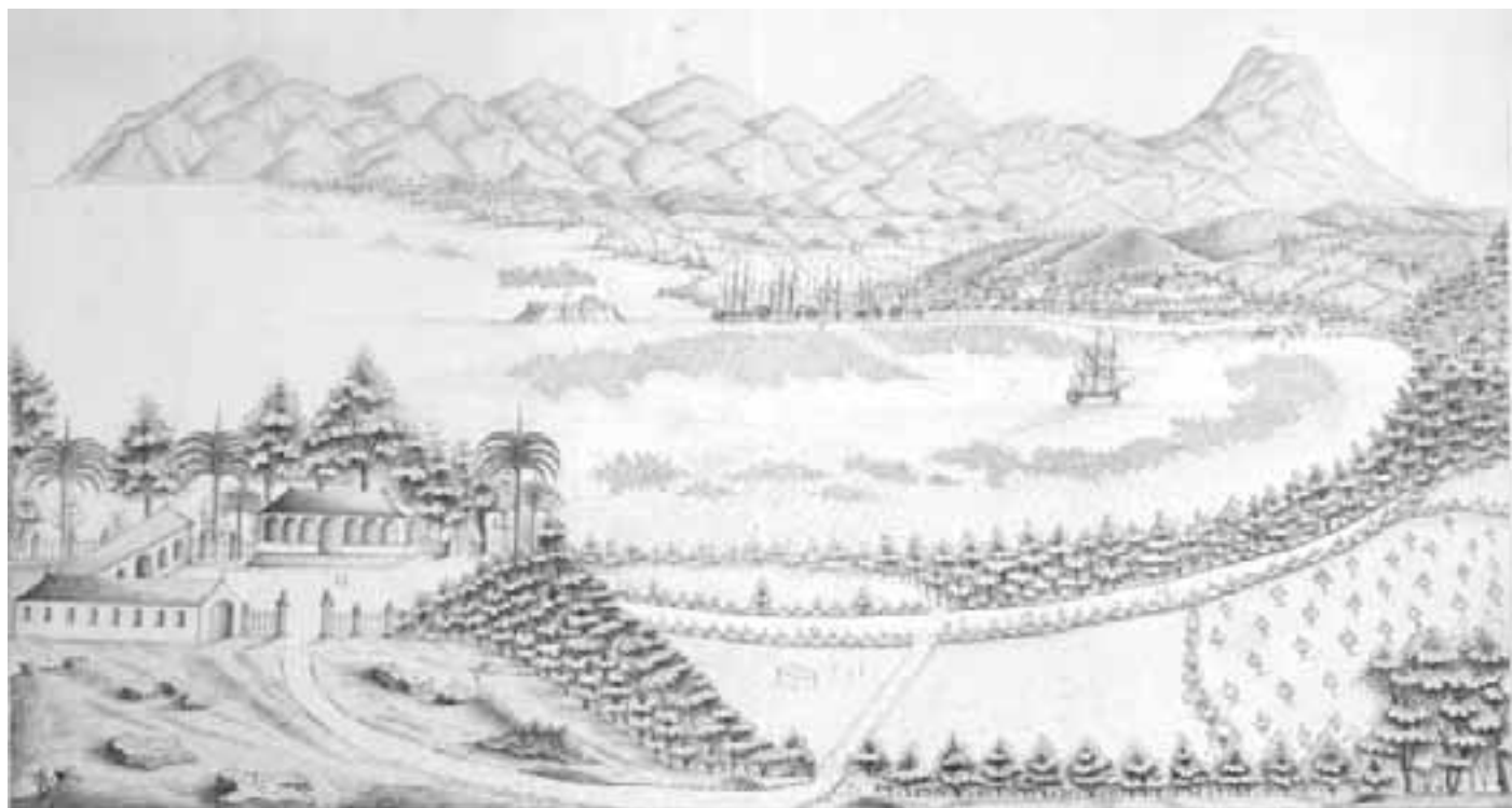
Port-au-Prince, în jurul anului 1800

proprietari. Alte terenuri au revenit patronilor de odinioară. Haitienii se vedeau obligați să muncească din nou pe plantații, deși aparent trăiau într-o țară liberă. Conflictele rasiale nu erau stăvilite nici în această perioadă, noi dispute iscându-se între mulatri și negri.