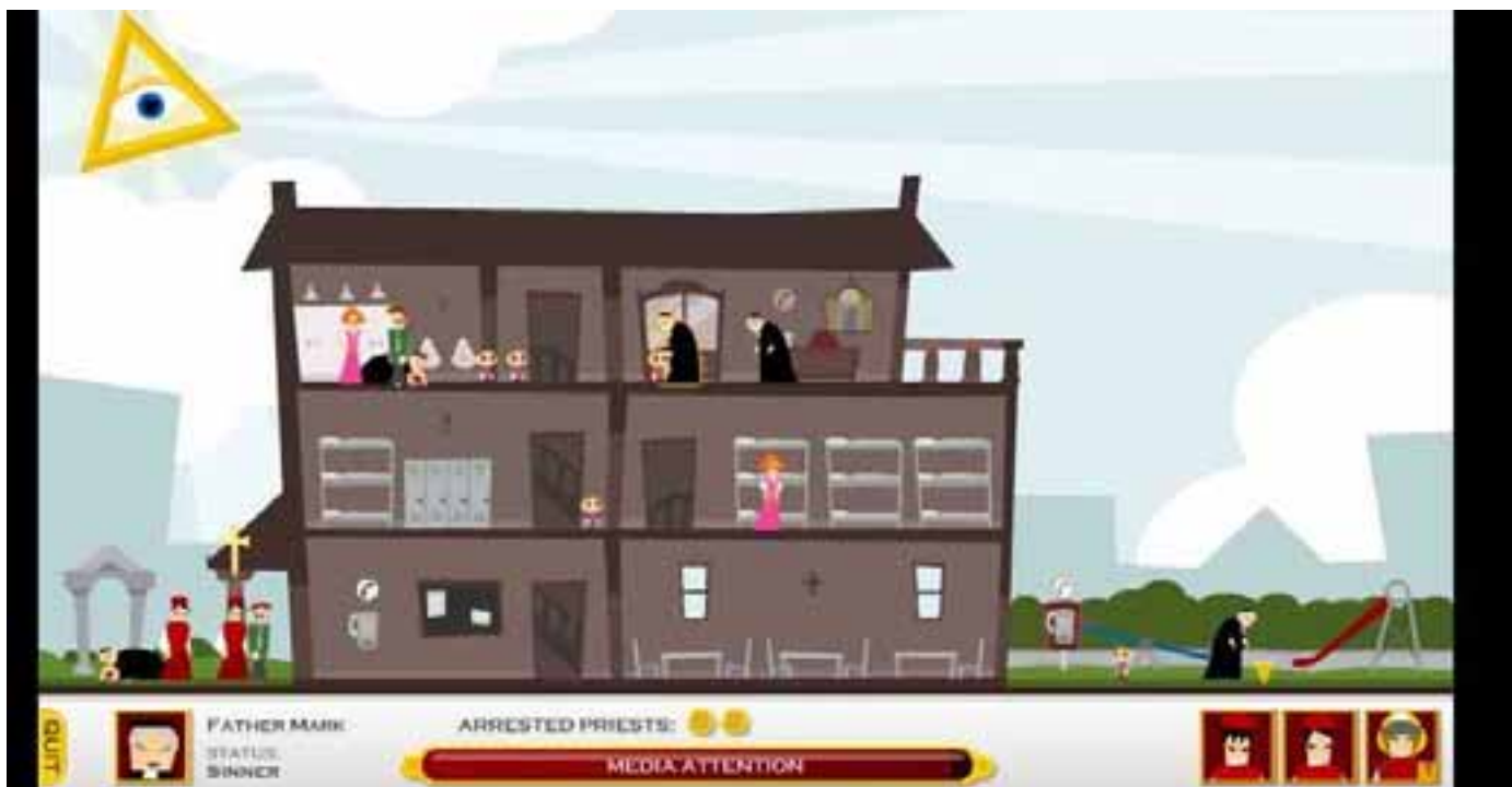
Imagine din jocul Operation: Pedo-priest

minerii (niște copii) să scoată o cantitate mare de coltan. Apoi, controlezi niște personaje care trebuie să prindă niște sinucigași ce se aruncă de la ferestrele unei fabrici de telefoane inteligente din China. Ca și primul mini-joc, și acesta este bazat pe fapte reale. În urmă cu câțiva ani, în acea țară, patronii unei fabrici de telefoane au montat plase în jurul clădirii, alarmați de numărul mare de lucrători care se aruncau de la fereastră. Dincolo de acest mini-joc eu nu am trecut, dar a fost destul ca să prind ideea. Scandalul care a avut în centru acest joc a pornit de la decizia companiei Apple de a-i interzice vânzarea în App Store. Până la acel moment, puțini auziseră de Molleindustria. Apoi, peste noapte, toată lumea și-a îndreptat atenția spre mica echipă. Așadar, scandalul le-a folosit, site-ul atrăgând acum fonduri prin care sprijină familiile sinucigașilor din China și copiii exploatați din Africa. Iată că și jocurile virtuale pot folosi la ceva!